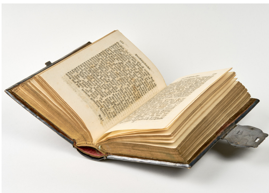
Modlitební knížka, Katholisches Lehr- und Gebetbuch depozitum 1245 ze židovského zabaveného majetku klasicistní, prkénková vazba s kovovou aplikací 1794 / Praha, vyd. Karl Heinrich Seibt