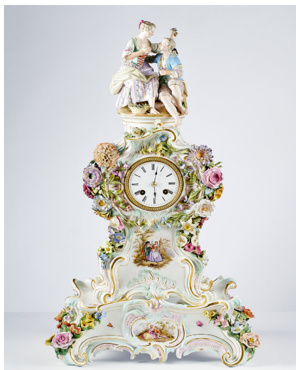
Hodiny stolní původní majitelka Regina Popperová porcelán, kov, 2. polovina 19. století / Míšeň

Pokračovala také fotografická dokumentace artefaktů, které prošly svozovým zámekem Sychrov a později byly buď zapůjčeny či převedeny na další objekty. Fotodokumentace probíhala na zámcích Benešov nad Ploučnicí (především hodiny, grafika a nábytek) a Vysoká u Příbrami, dále pak v Oblastní galerii Liberec, Uměleckoprůmyslovém museu v Praze a na Úřadu vlády ČR. Z důvodu trvající pandemie a protipandemických opatření bylo mimořádně složité dojednat i následně zrealizovat fotografování jednotlivých uměleckých předmětů. Velká část jeho již předem naplánované a domluvené realizace musela být přesunuta na první polovinu roku 2022.